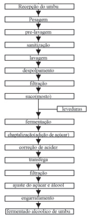
(FIGURA A) - fluxograma do processo de produção do fermentado alcoólico de umbu.

Para a elaboração do vinho de umbu, foram utilizados 24.045 Kg do fruto ( Spondias tuberosa Arruda Câm ), verificando algumas características presentes na fruta, como a cor e a aparência. Os frutos passaram por uma seleção visando eliminar os frutos machucados para não comprometer o processo fermentativo. Após a seleção, os frutos foram lavados com bastante água corrente, para eliminar as sujeiras mais grosseiras e poder então ser processada a etapa de sanitização com hipoclorito de sódio, durante 15 minutos, que tem por objetivo a redução da carga microbiana presente na casca.