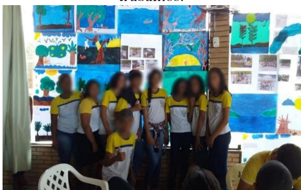
Figura 3. Alunos apresentando seus trabalhos.