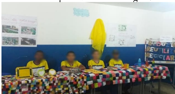
Figura 5. Feira de ciências: apresentação sobre a importância da reciclagem.