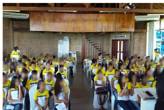
Figura 4. Alunos na palestra do biólogo.