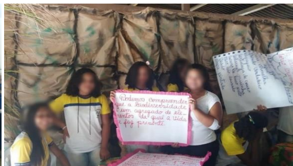
Figura 6. Feira de ciências: apresentação sobre a biodiversidade brasileira.