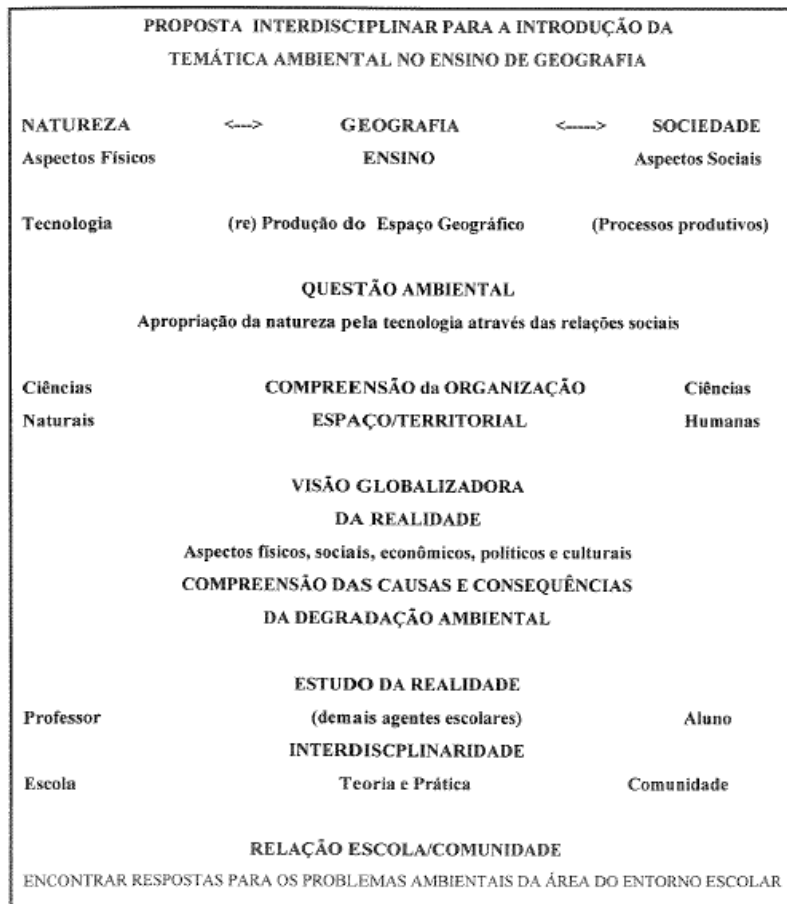
Figura 1. Proposta interdisciplinar para a introdução da temática ambiental no Ensino de Geografia.

fim de que possa contribuir com uma visão mais globalizada da realidade” (BORTOLOZZI, 1997, p. 83).