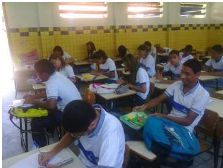
Figura 4. Alunos respondendo as perguntas.