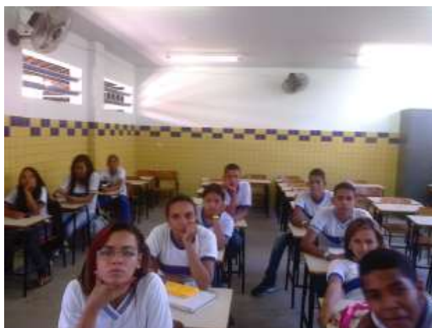
Figura 2. Alunos assistindo a reportagem de Rachel Sheherazade.

De início foi proposto que os discentes expressassem suas posições sobre o texto da jovem através de uma imagem impressa que lhes foi mostrado durante a aula, muitos deles criticaram essa atitude, desaprovando o que a estudante fez, em um segundo momento fazendo o uso do notebook, os alunos assistiram a reportagem apresentada pela jornalista Rachel Sheherazade, a reportagem pode ser facilmente encontrada na internet, aonde a jornalista expressa sua opinião crítica a respeito da postagem a jovem. Após a apresentação levamos os alunos a refletir sobre indagações como: Qual sua opinião a respeito das postagens feita pela jovem estudante de Direito? Atitudes como essas estão presentes na sociedade contemporânea? Como? O que você acha da sentença dada à jovem? Conhecer ou lembrar-se da situação pode ajudar outros jovens a pensar duas vezes antes de propagar o não respeito à diversidade dos sujeitos? Há possibilidade de se desconstruir preconceitos como o demonstrado pela jovem? Como?