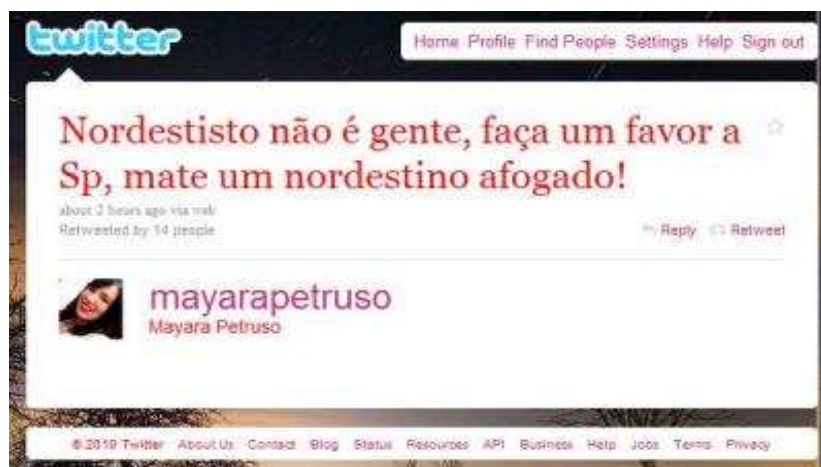
Figura 1. Postagem depreciativa feita contra nordestinos.